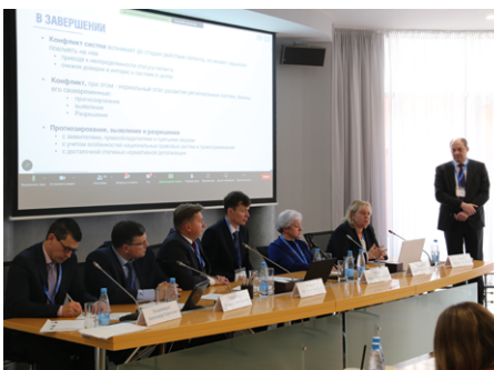
НА ФОТО: КРУГЛЫЙ СТОЛ «ЕВРАЗИЙСКОЕ ИЛИ НАЦИОНАЛЬНОЕ ПАТЕНТНОЕ ВЕДОМСТВО»

для совместного развития успешного бизнеса.