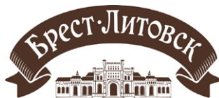
Международный знак № 1518860

В качестве основания для отказа Роспатент указал, что представленные заявителем документы не позволяют сделать однозначный вывод о том, с каким лицом ассоциируется данное обозначение, поскольку на территории Российской Федерации хозяйственную деятельность ведет ООО «Савушкин продукт» и ООО «Савушкин продукт-Москва», и из совокупности всех представленных материалов не формируется представление о взаимосвязи заявленного обозначения с иностранной компанией заявителя ОАО «Савушкин продукт» (ВУ).