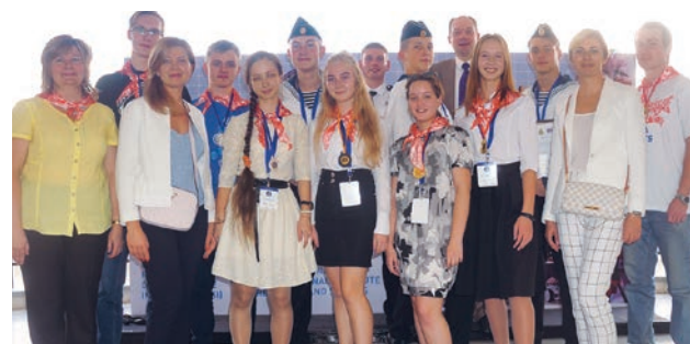
Фото: Российские участники Впервые Международная выставка юных изобретателей IEYI состоялась в 2004 году в Токио и стала международным продолжением проходившей ежегодно с 1904 года национальной выставки. На протяжении 14-ти лет выставка проводится в разных государствах Азии и Африки, в этом году выставка была организована Фондом

Продолжая реализацию собственных социальных проектов, Юридическая фирма «Городисский и Партнеры» выступила со-организатором и спонсором участия российской делегации в Международной Выставке Молодых Изобретателей (International Exhibition for Young Inventors/IEYI).