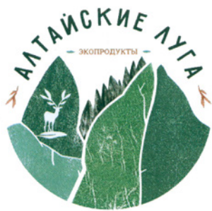
Товарный знак № 670510

Общество обратилось в Арбитражный суд Алтайского края с иском с заявлением к АО сельскохозяйственное предприятие «Алтайские луга» (далее — Предприятие) и потребовало обязать Предприятие прекратить использование сходного с Товарным знаком обо-