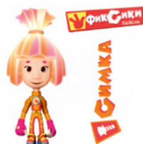
Товарный знак № 502206

В СПОРЕ О ДОСРОЧНОМ ПРЕКРАЩЕНИИ ПРАВОВОЙ ОХРАНЫ ТОВАРНОГО ЗНАКА В СВЯЗИ С НЕИСПОЛЬЗОВАНИЕМ ВС УКАЗАЛ НА НЕОБХОДИМОСТЬ ДОКАЗЫВАНИЯ НЕ ТОЛЬКО НАМЕРЕНИЯ ИСПОЛЬЗОВАТЬ ТОВАРНЫЙ ЗНАК, НО И РЕАЛЬНОЙ ЗАКОННОЙ ВОЗМОЖНОСТИ ИСПОЛЬЗОВАНИЯ СПОРНОГО ОБОЗНАЧЕНИЯ (ОПРЕДЕЛЕНИЕ ВС РФ ОТ 6.10.2025 № 300-ЭС25-2343 ПО ДЕЛУ № СИП-1077/2023)