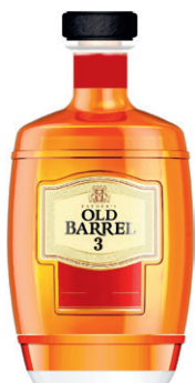
Заявка на товарный знак № 2019702683

Исключая из охраны форму бутылки, Роспатент указал, что форма бутылки не обладает набором признаков, необходимых и достаточных для её запоминания потребителями, то есть не обладает различительной способностью.