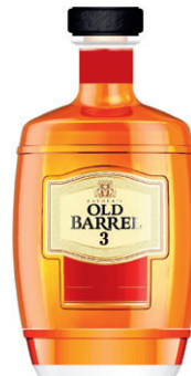
Промышленный образец № 118953

ской Федерации на промышленный образец № 118953 с такой же формой бутылки.